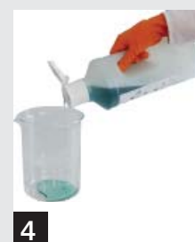
4 Слить содержимое дозированной головки