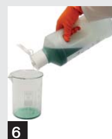
6 При необходимости этапы 4-6 повторить.