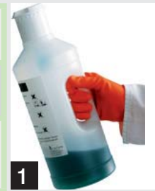
1 Налить концентрат во флакон-дозатор