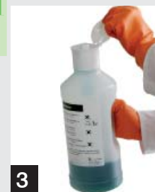
3 20 мм концентрата находится в дозированной головке